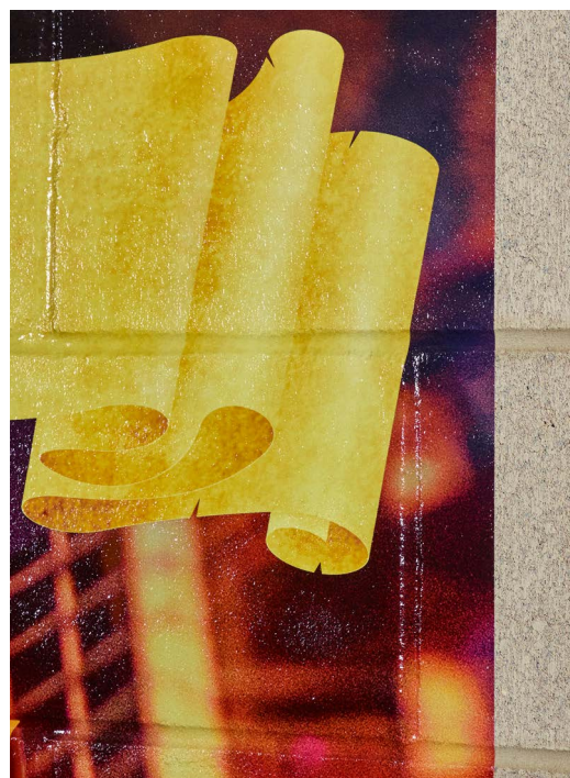
3M 780 mC